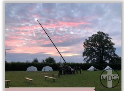
2017 - Lorup Hövel

Die Adresse unseres Zeltplatzes "Jugendzeltplatz Lorup Hövel" lautet Hövel 1, 26901 Lorup . Vor Ort nutzen wir ein Versorgungsgebäude sowie umfangreiche Sanitäranlagen. Auf dem ca. 1,5 ha großen, eingezäunten Zeltplatz werden die Lagerteilnehmer, wie jedes Jahr, in unseren hochwertigen Zelten der Messdienergemeinschaft Dinklage übernachten. Dort findet jeder ausreichend Platz für sein Gepäck und Feldbett oder Matratze. Die restliche Fläche des Platzes kann problemlos als Spielgelände für verschiedene Spiele genutzt werden. So können die 10 actionreichen Tage garantiert für keine/-n Lagerteilnehmer/-in langweilig werden.